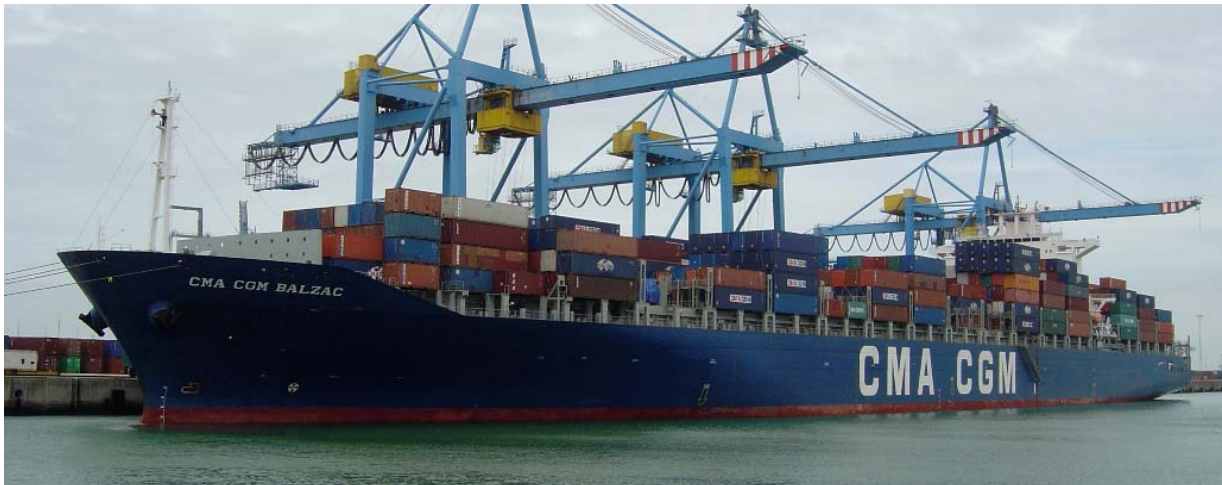
The CMA CGM BALZAC visited the port of Zeebrugge