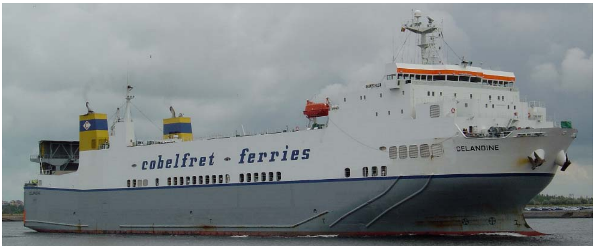
Cobelfret's CELANDINE in the port of Zeebrugge

VLIERODAM, STRONG QUALITY IN LIFTING AND HOISTING EQUIPMENT.