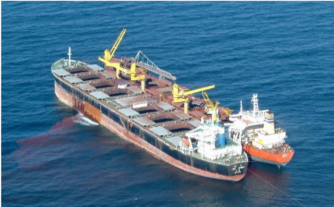
The BANDAR moored alongside the CAPE AFRICA

THE 149,533dwt bulk carrier Cape Africa , which has been at anchor in False Bay since April, was towed into Cape Town harbour behind the salvage tug Smit Amandla to undergo permanent repairs. The stricken bulker has been lightened by having around 80,000 tonnes of iron ore transferred to the specialised lightening vessel Bandar , which had been chartered in for the purpose. The 1991-built Cape Africa was approaching the coast of South Africa on a voyage from Brazil to China when it suffered a 20m x 5m tear in the hull. After transferring 1,900 tonnes of bunker fuels at sea onto the