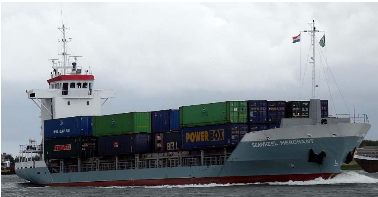
The SEAWHEEL MERCHANT enroute Rotterdam