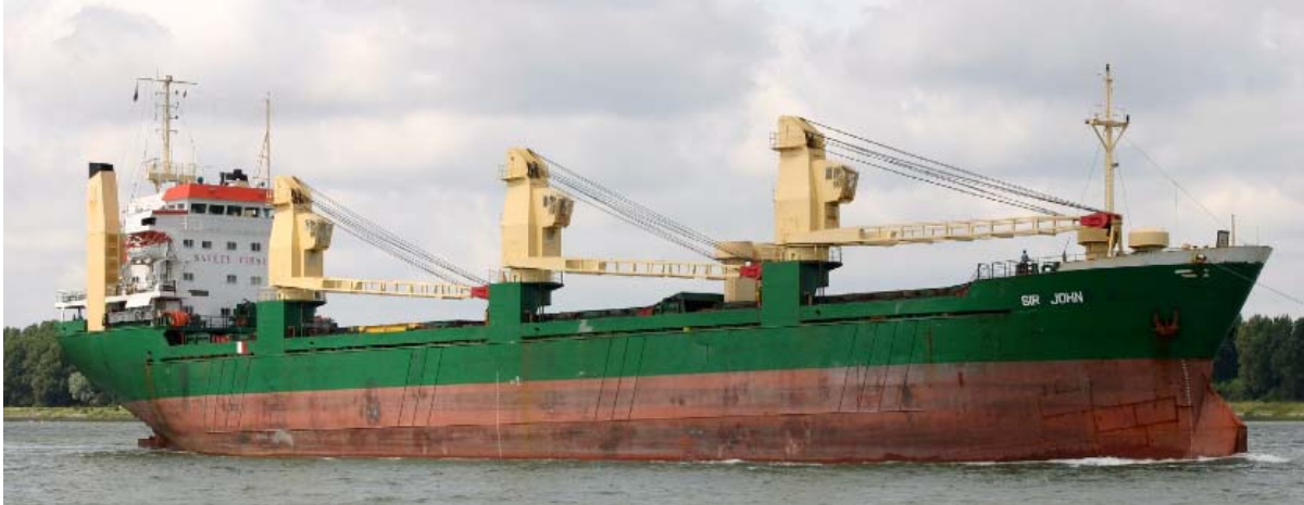
The SIR JOHN is the former Carola Smits