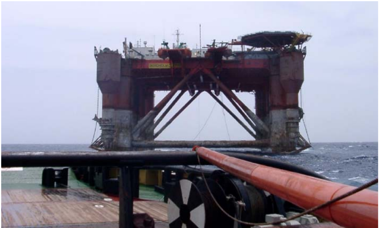
The semisubmersible rig BORGHOLM D under tow of the Smitwijs Singapore